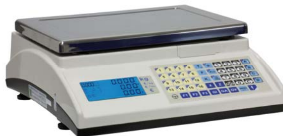
Marte 10 V4

Balanza sobre mostrador, multifunción, Peso-Tara, Niveles y Cuentapiezas