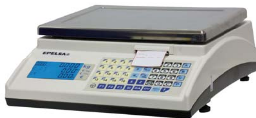
Marte 10 V4 ILC

Balanza sobre mostrador, cuatro vendedores, impresora, interconectada.